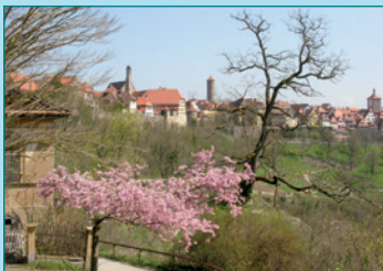
Ansicht von Westen

In Rothenburg ob der Tauber sind alle wichtigen Bildungseinrichtungen vorhanden: Kinderkrippen für unter 3-jährige, Kindergärten, Grund- und Hauptschule, Realschule, Gymnasium, Berufsschule, Förderschule, Krankenpflegeschule, Musikschule, Gastronomisches Bildungszentrum der IHK.