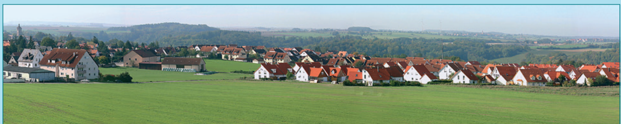
Wohngebiete in Rothenburg ob der Tauber