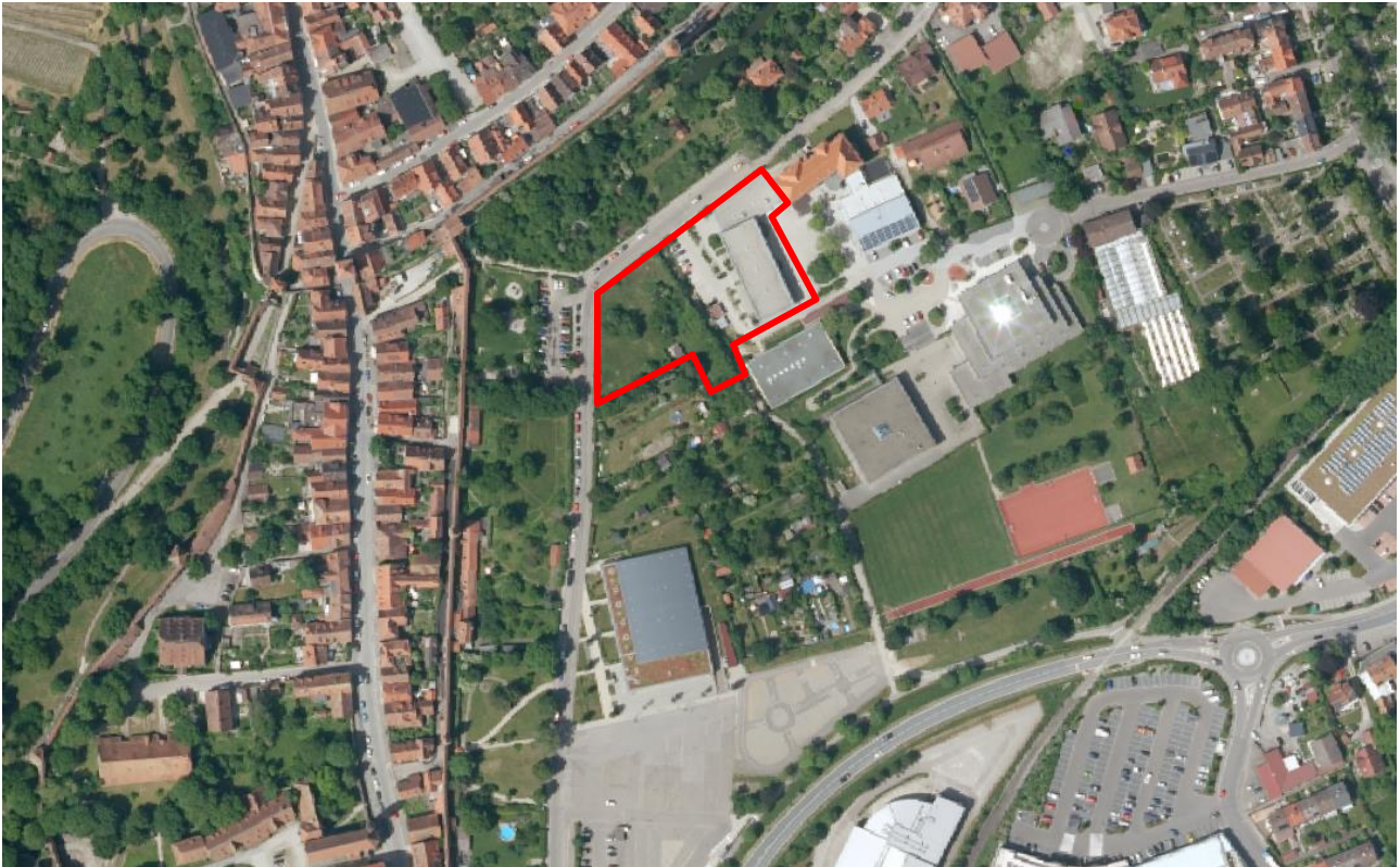
Abbildung 3: Luftbild, rot: Vorhabensgebiet

Ein großer Teil des Vorhabensgebietes bildet eine extensive Wiese mit teilweise freistehendem Gehölz- sowie Heckenriegeln (Abb. 4 und 5). Die nordwestliche Grenze des Grundstückes wird durch einen Holzzaun zu den Straßen Topplerweg und Friedrich-Hörner-Weg abgegrenzt (Abb. 4, 5 und 6). Entlang der westlichen und südlichen Grenzen des unteren Abschnitts des Vorhabensgebiets liegen Hecken- und Baumstrukturen unterschiedlichen Alters (Abb. 7 und 8). Höhlen und Totholz sind so weit nicht vorhanden. An der Südgrenze stehen vor allem große Tujahecken und -bäume sowie ein Feldahorn, während die Ostgrenze der Wiesenfläche von im Süden beginnend älteren Obstbäumen und Efeugewächsen beherrscht wird und Richtung Norden zunehmend jüngere Hecken und Bäume vorherrschen. An der südwestlichen Ecke zur Merzweckhalle steht ein Gartenbungalow mit Überdachung und befestigter Terrasse (Abb. 9). Zuletzt finden sich im nordöstlichen Teil der Wiesenfläche einige freistehende junge Obstbäume. Der zweite Teil des Vorhabensgebietes ist das östlich der Wiese stehende Schulgebäude mitunter des Parkplatzes dazwischen. Unter Absprache mit der unB Ansbach wurde das Untersuchungsgebiet mittels Worst-Case-Verfahren auf die in Bayern vorkommenden saP-relevanten Tier- und Pflanzenarten untersucht.