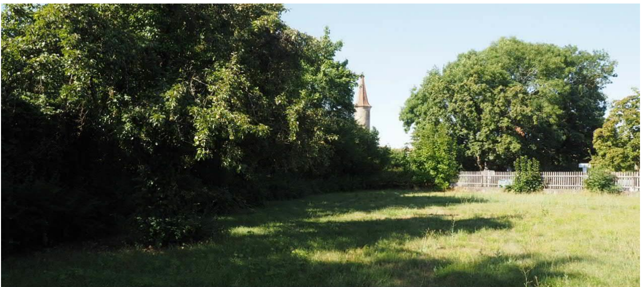
Abbildung 7: Hecken- und Baumstrukturen im Süden des Vorhabensgebietes