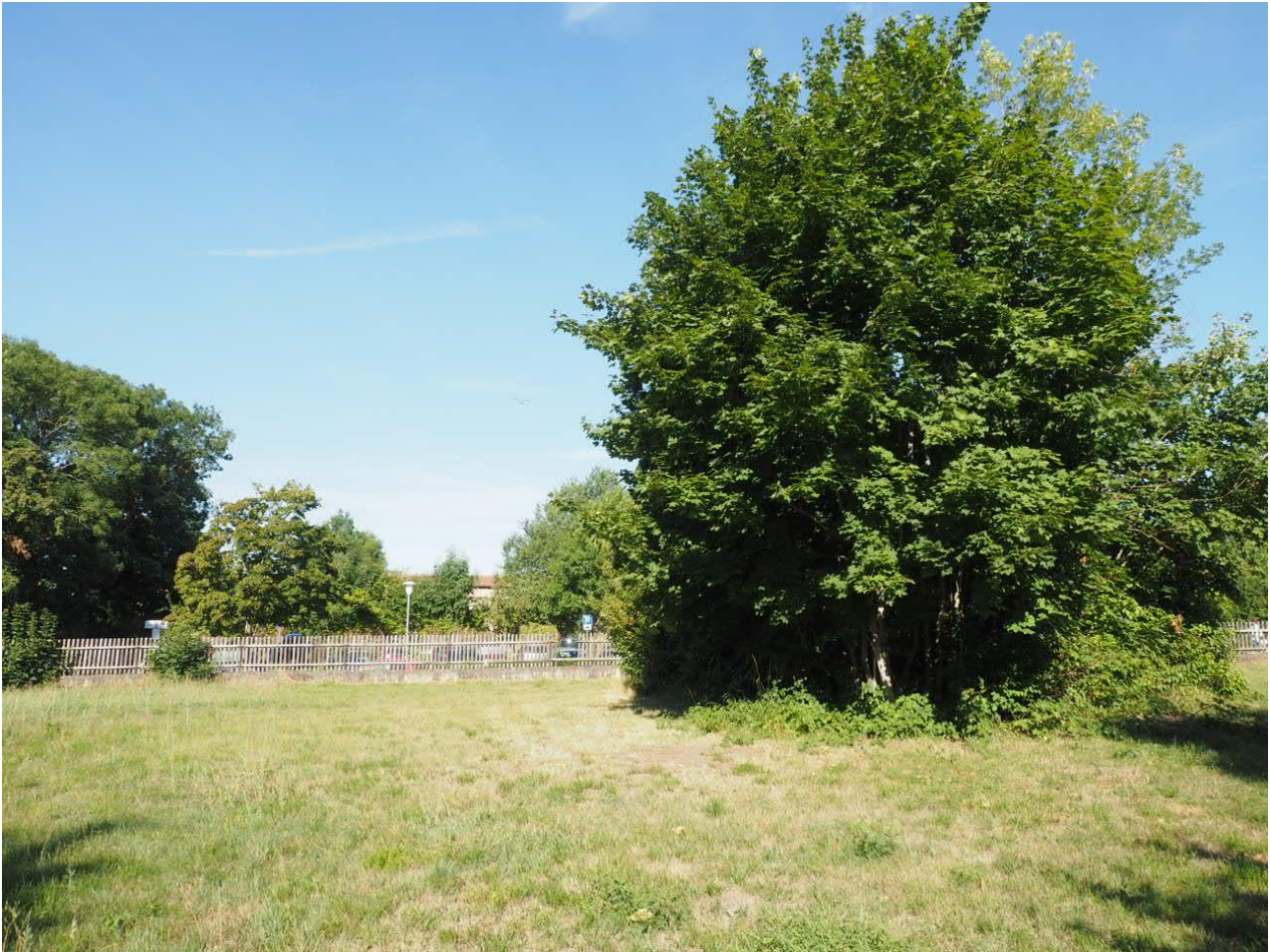
Abbildung 5: Westlich liegender Gehölzriegel im Vorhabensgebiet