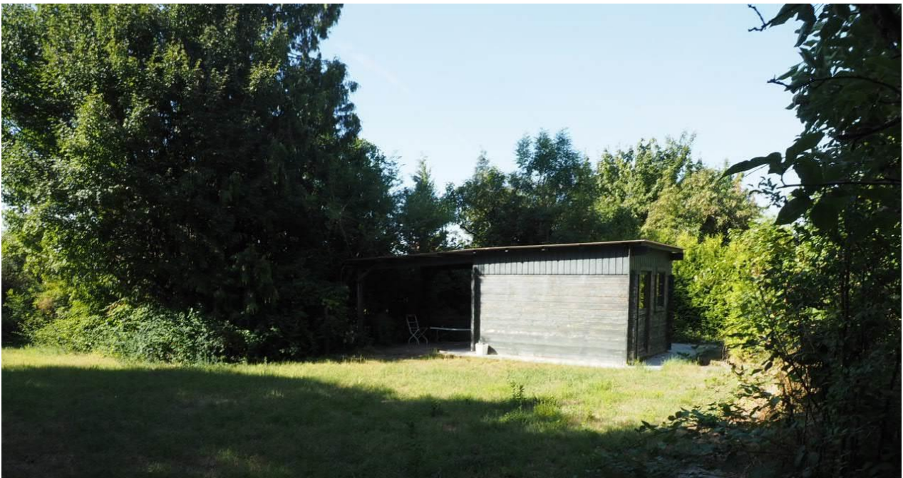
Abbildung 9: Gartenbungalow mit überdachter befestigter Terrasse an der südwestlichen Ecke des Vorhabensgebietes, angrenzend zur Merzweckhalle