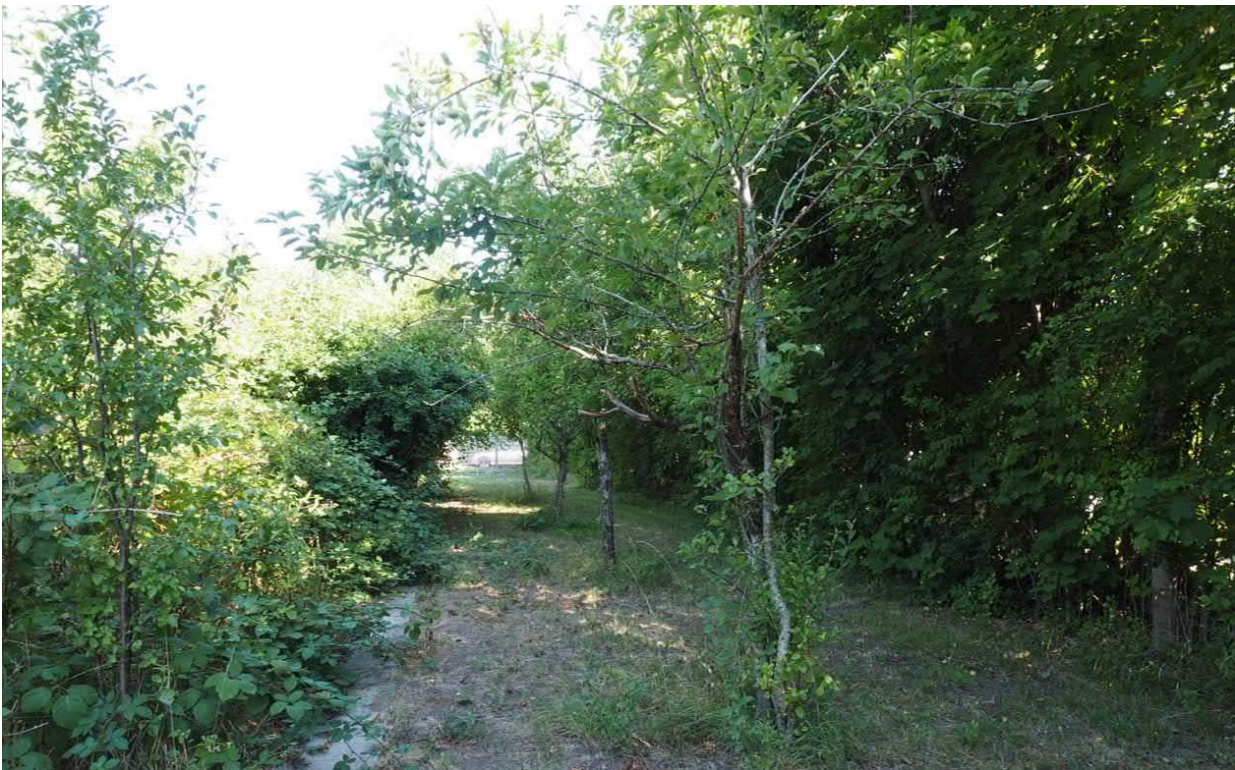
Abbildung 10: Reihe von jungen Obstbäumen im Osten des Vorhabensgebietes