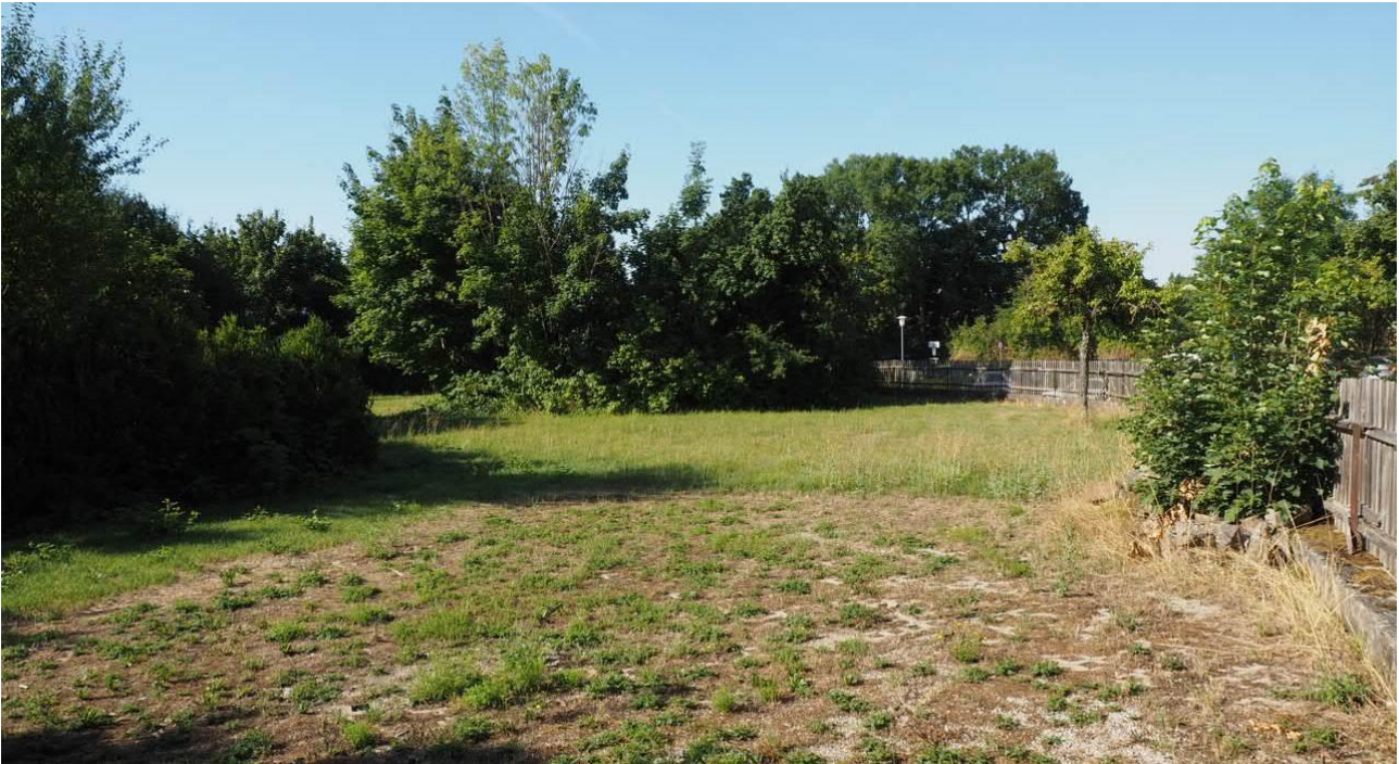
Abbildung 4: Extensive Wiese und verschiedene Heckenstrukturen im nördlichen Teil des Vorhabensgebietes