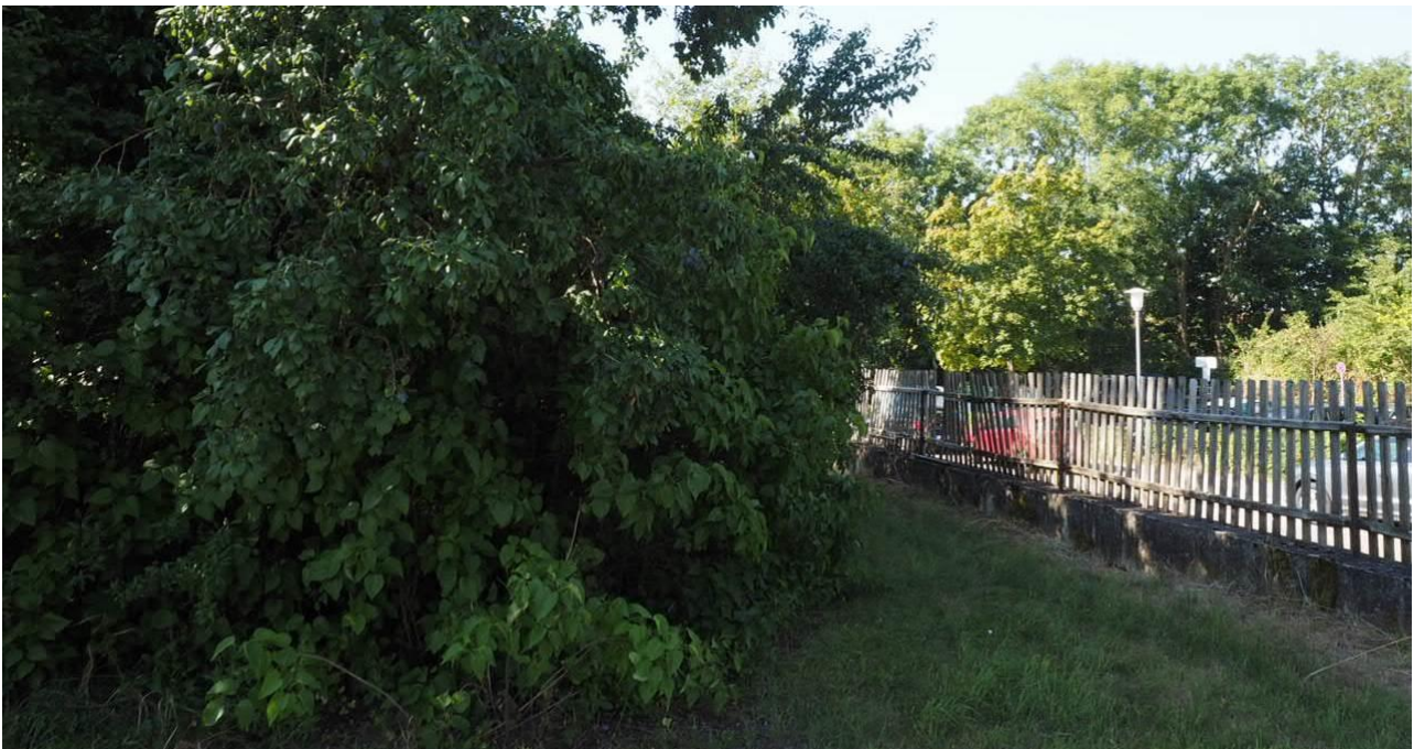
Abbildung 6: Abgrenzung des Vorhabensgebietes durch Holzzaun