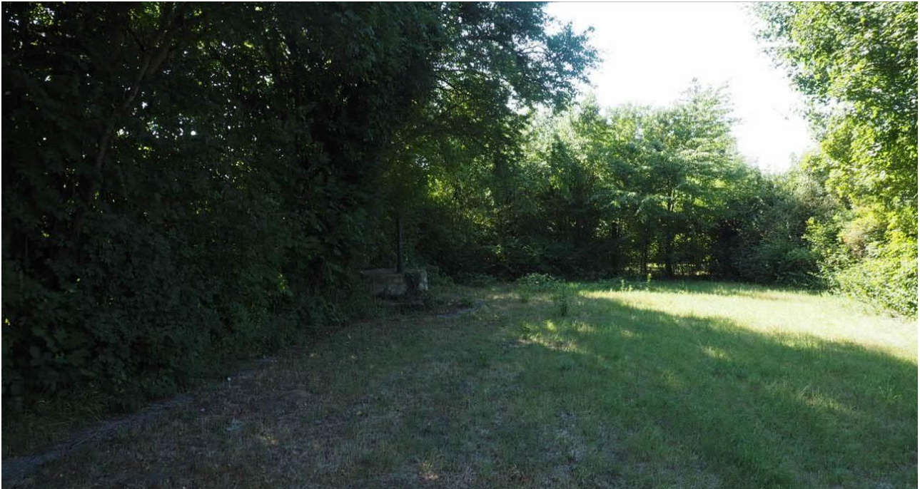
Abbildung 8: Hecken- und Baumstrukturen im Süden und Osten des Vorhabensgebietes