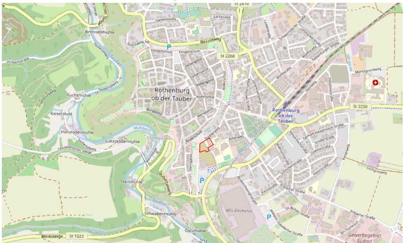
Abbildung 1: Lage des Vorhabensgebiets (rot umrandet)

Auftraggeber: Stadt Rothenburg o.d.T Stadtbauamt/ Abt. Hochbau Grüner Markt 1 91541 Rothenburg o.d.Tauber